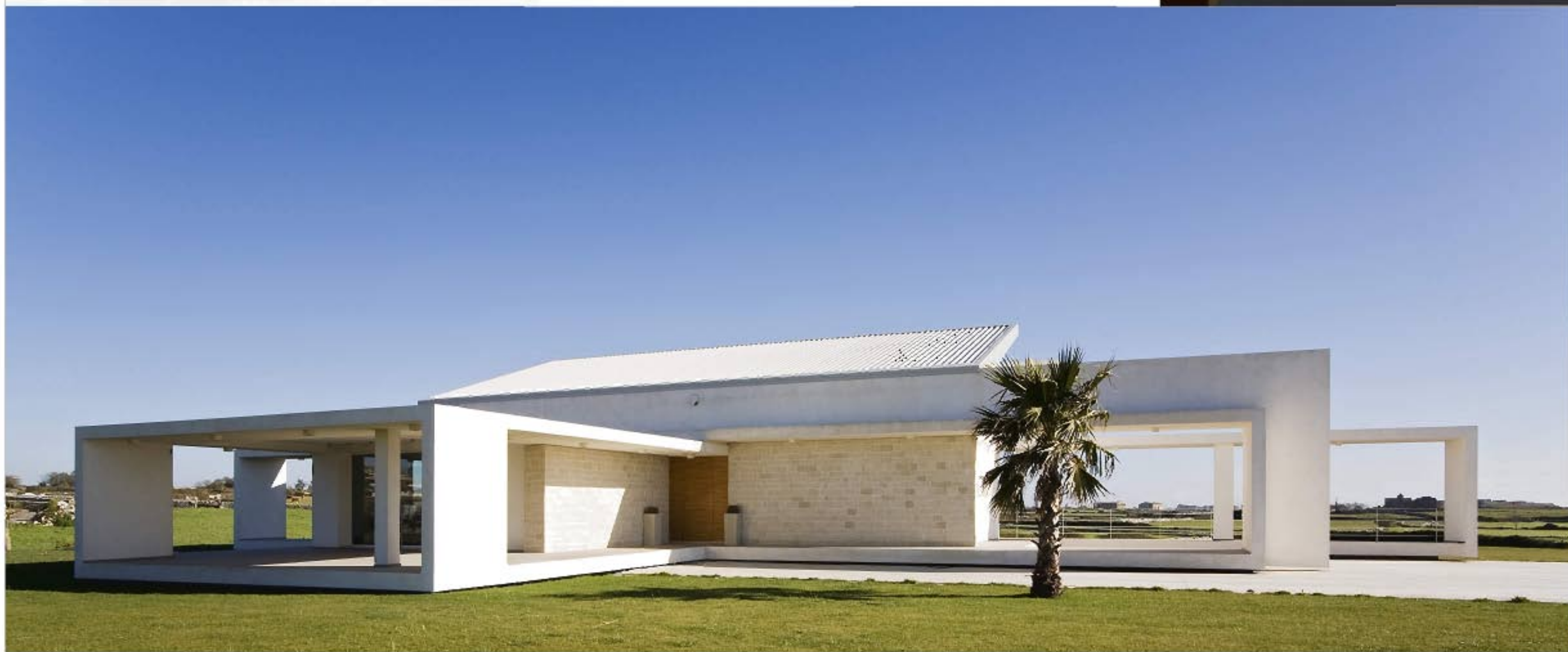
VILLA T Ragusa